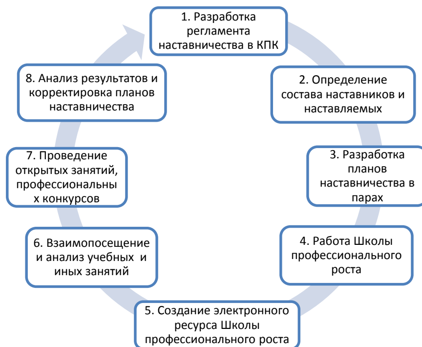
Рис. 1 – Алгоритм корпоративного наставничества в ГБПОУ КК «Краснодарский педагогический колледж»

В круг задач наставников, определяемых из числа наиболее квалифицированных, результативных педагогических работников, входит: